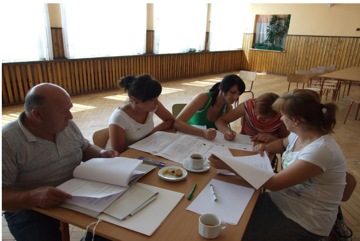
Grupa Odnowy Wsi z Rokietnicy w trakcie warsztatów.

Szkolenie uzyskało wśród uczestników wysokie i bardzo wysokie oceny – średnia 4,7. Najlepiej oceniono ogólny poziom, atmosferę i relacje między uczestnikami i trenerami oraz przygotowanie trenerów.