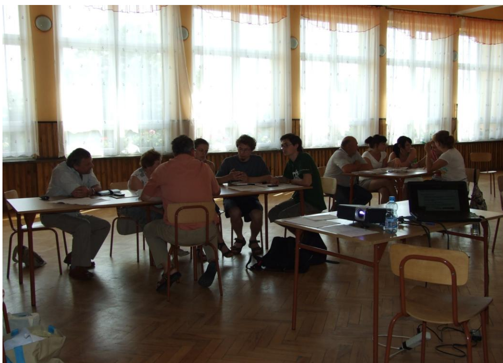
Sala GOK w Kańczudze.

Rokietnica wieś z bogatą infrastrukturą, aktywnymi i przedsiębiorczymi mieszkańcami dbającymi o dobry stan środowiska, z ukształtowaną tożsamością i żywymi tradycjami.